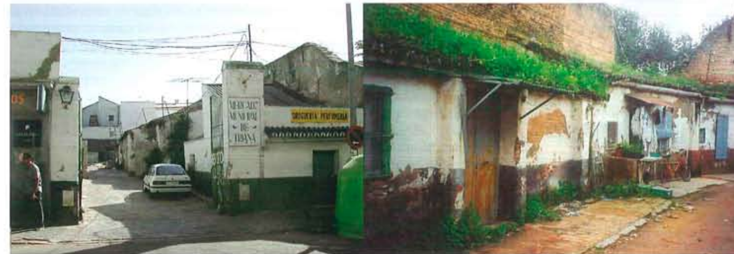
Representativas imágenes de lo que en su día fueron los solares donde se ubica Galia Triana

“Frente al habitual urbanismo extensivo de los últimos años, Galia Triana vuelve hacia lo ya existente, aportando calidad a la trama urbana”