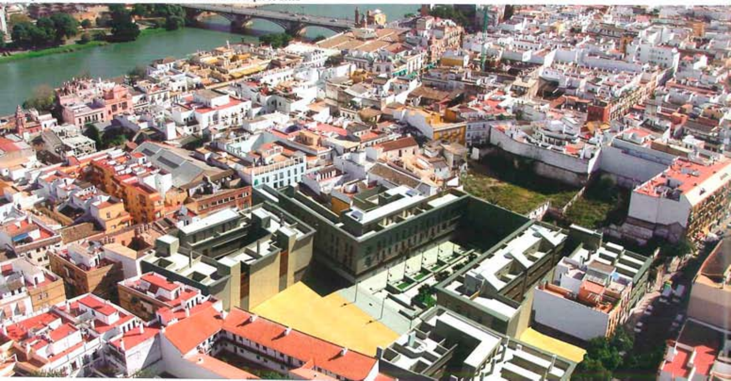
Integración en 3D del nuevo residencial en el entorno en el que se ubica

En definitiva, Galia Triana es mucho más que una promoción de viviendas; es un nuevo concepto de edificación confortable, sostenible y distinguida, al servicio de la ciudad y del ciudadano. Ai