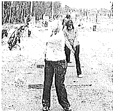
ESTRENO. Vista de las instalaciones del Villanueva Golf Resort, aún por concluir pero ya en funcionamiento.