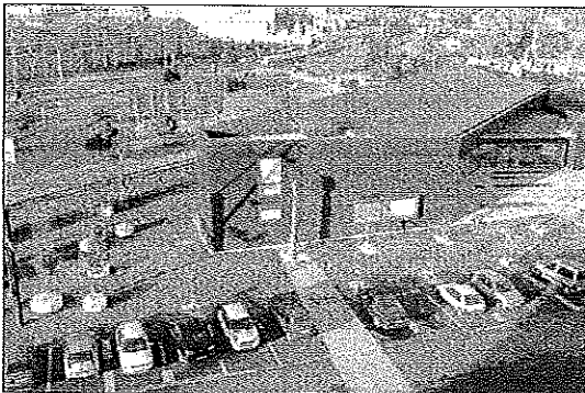
El segundo edificio está destinado al estudio de arquitectura. /E/F

En relación a las calidades, cabe destacar que las oficinas cuentan con suelo técnico de alto tránsito (con la posibilidad de llevar el cableado a cualquier punto de la oficina bajo el suelo), techo técnico y fibra óptica, así como sistemas de climatización que otorgan un ambiente de confort continuo y un ahorro energético considerable, convirtiendo a los edificios en un proyecto enmarcado en el ámbito de sostenibilidad acorde a los tiempos actuales. Respecto a las zonas comunes se han utilizado diferentes materiales como basalto, stonker, madera o acero corten.