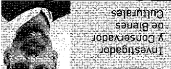
Investigador y Conservador de Bienes Culturales

El cartel cerámico fue colocado en la fachada de El Sport con el fin de promocionar el modelo entre la selecta clientela del bar que solían acudir a los comercios de la calle Tetuán o darse cita frente al local cuando había función en el Teatro San Fernando. Este nuevo espíritu tuvo su efecto en la ciudad, que en los siguientes años 20 sufrió una transformación urbana promovida, en parte otras causas, por la presencia del automóvil, que abarcaba ya su función de entretenimiento para convertirse en el medio de transporte de las clases sociales más altas.